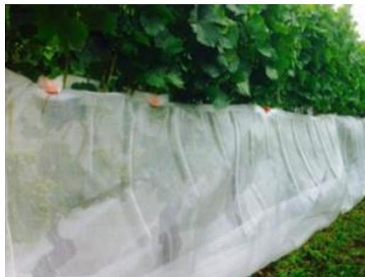
Protiinsektna mreža v vinogradu.

Protiinsektne mreže so trenutno najučinkovitejši ukrep za preprečevanje škode zaradi plodove vinske mušice. Mreže namestimo takoj po cvetenju in odstranimo po spravi pridelka. Uveljavila sta se dva načina prekrivanja: prekrije se lahko celoten