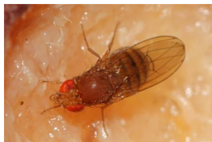
Samica plodove vinske mušice.

Prezimi kot odrasla žuželka (muha) na zaščitениh mestih. Oplojena samica išče zoreče ali že zrele plodove, v katere odlaga jajčeca. Za razliko od drugih vrst vinskih mušic napada zdrave nepoškodovane plodove. Žerke se zabubijo blizu izhoda iz napadenega ploda ali pa plod zapustijo in se zabubijo v tleh. Plodova vinska mušica potrebuje razmeroma kratek čas za razvoj od jajčeca do odrasle muhe. V ugodnih razmerah lahko razvije do 15 rodov na leto.