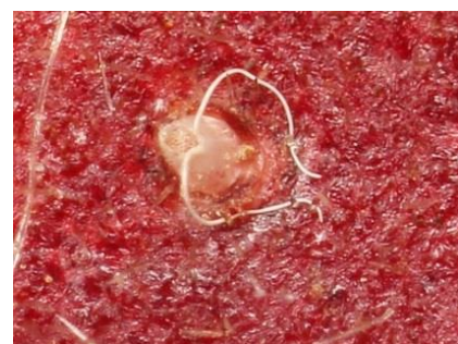
Jajčece plodove vinske mušice.