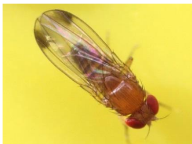
Samec plodove vinske mušice.

Plodova vinska mušica je tujerodna vrsta , ki je bila v Evropo vnesena iz Azije in se je v preteklih letih razširila v številne evropske države. Škodljivec napada plodove številnih gojenih in prosto rastočih rastlin. V nekaterih evropskih državah in tudi pri nas je v zadnjih letih povzročila gospodarsko škodo predvsem na jagodičevju in koščičarjih.