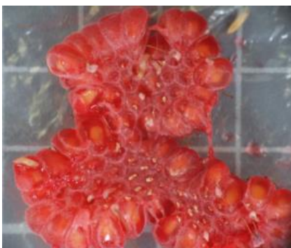
Žerke v plodu maline.