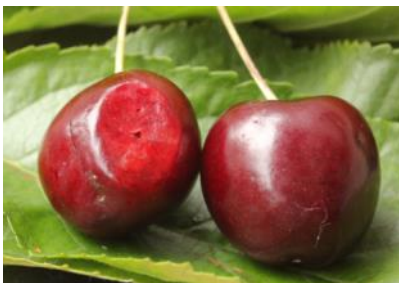
Poškodbe na češnjah – mesto napada.

Za razliko od drugih vrst vinskih mušic plodova vinska mušica napada še nezrele in nepoškodovane plodove. Samice med odlaganjem jajčec poškodujejo povrhnjico plodov, luknjice so vidne. Na mestu vboda se tkivo po 2 do 3 dne, ko se izležejo žerke, zmechča in ugrezne. V notranjosti takega ploda najdemo žerke, ki se prehranjujejo z mehkim tkivom plodov in ga spreminjajo v kašasto gmoto. Na mestu vboda se običajno naselijo različne glive ali bakterije, ki povzročajo gnitje plodov. Napadeni plodovi so zato večinoma povsem neuporabni.