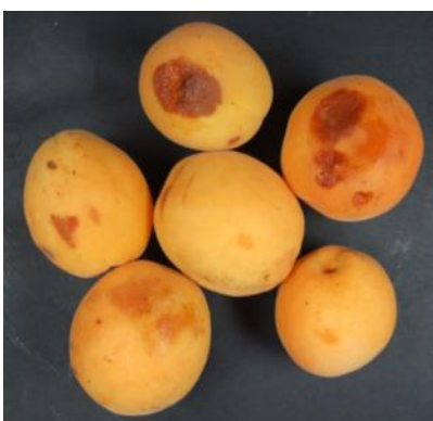
Poškodbe na marelicah.