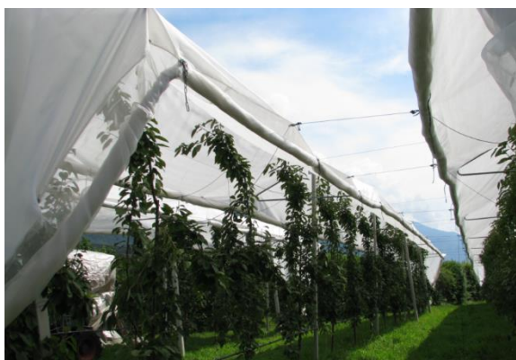
Prekrivanje posameznih vrst.