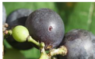
Poškodbe na grozdni jagodi.