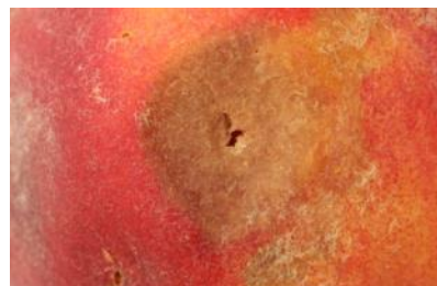
Poškodbe na breskvah.