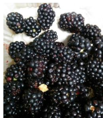
Poškodbe na robidah.