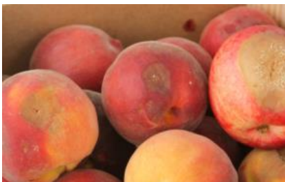
Poškodbe na breskvah: na poškodovanem tkivu se je razvila sadna gniloba.