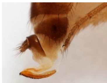
Drosophila suzukii – leglica.