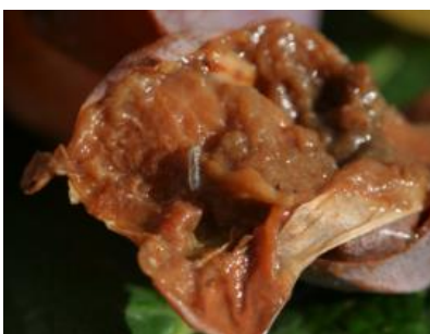
Žerka na grozdni jagodi.