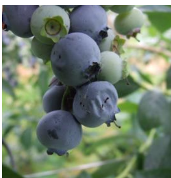
Poškodovani plodovi borovnice.