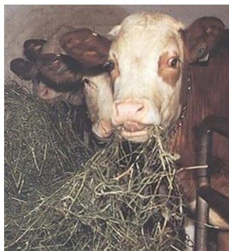
Slika št. 2: Kvalitetna mrva je osnova

O posebnostih prebave in metabolizmu beljakovin in ogljikovih hidratov, razgradljivosti aminokislin, zaščitnih (bypass) proteinih in ostalih kemičnih procesih v prebavnem sistemu govedu v tem tehnološkem listu ne bomo razpravljali, saj bi gradivo postalo preobsežno in za potrebe ekoloških rejcev govedu manj uporabno.