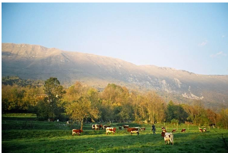
Slika št. 1: Cike na poletni paši

Prežvekovalci, med katere sodi tudi govedo, se od neprežvekovalcev razlikujejo predvsem po drugačni zgradbi prebavnega sistema. Prežvekovalci imajo pred-želodce, kjer se hrana najprej skladišči in nato s pomočjo mikroorganizmov razgradi. Pri odraslem govedu obsegajo pred-želodci okrog 150 l prostornine, pravi želodec nekje okoli 15 l, tanko, debelo in slepo črevo pa skupaj še 100 l. Skupni volumen prebavil tako znaša okoli 260 l. V pred-želodcih (vamp, kapica in prebiralnik) prebavljajo hrano mikroorganizmi, v ostalem delu prebavil pa pretežno fermenti, ki jih izločajo živali same. Velika prostornina prebavil in sposobnost mikroorganizmov, da razgrajujejo celulozo, jih postavlja v poseben položaj, saj lahko zauživajo voluminozno krmo, ki za človeka in mnoge domače živali ni uporabna. Opisana lastnost in sposobnost, da lahko s pomočjo mikroorganizmov iz nebeljakovinskega dušika in ustreznih nebeljakovinskih substanc in energije ustvarjajo nove beljakovine, jim daje lepo perspektivo predvsem v takih podnebnih in talnih razmerah, kot jih ima Slovenija, kjer je v posameznih predelih nad 80 % vse kmetijske zemlje travnikov in pašnikov.