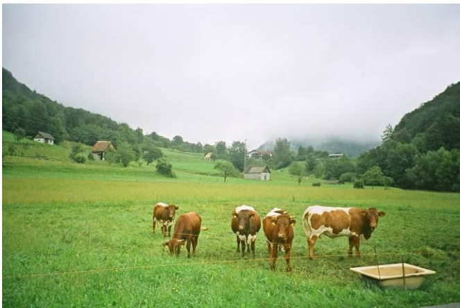
Slika št. 3: Enostavna rešitev napajanja živine na pašniku