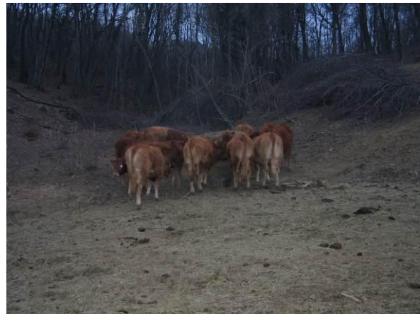
Slika št. 4: Dokrmeljevanje živine na zimski paši

Presušene krave in telice potrebujejo pri temperaturah okoli 20°C 4 – 5 l vode na kg zaužite SS. Z dvigom temperature se potreba zviša do porabe 5,5 l vode na kg SS. Pri kravah molznicah veljajo iste vrednosti, vendar moramo na vsak proizveden l mleka prišteti še 0,9 l vode. Tako potrebuje krava, ki proizvede 25 l mleka in zaužije 18 kg SS na dan, okrog 120 l vode. Seveda moramo pri količini vode odšteti tisto vodo, ki jo krava dobi s krmo in presnovo hranilnih snovi. Tako krava popije še 50 – 70 l vode, najbolje pa je, da imajo živali vodo vedno na razpolago. Največ vode popijejo krave 1 – 3 ure po večerni molži.