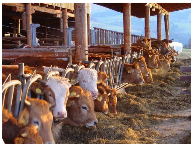
Slika št. 6: Tudi svetloba v hlevu je pomembna

Pri celoletni pašni reji krav dojlj pa je bolje, da so osemenjene nekje med sredino maja in sredino junija. Krave dojlje bodo tako telile v februarju do sredine aprila, ko ruša že dobro prirašča. Teleta bomo odstavili do konca septembra. Paša krav dojlj s teleti mora biti nadzorovana in pravilno vodena po skupinah. Vzdrževalne potrebe po hranilnih snoveh pozimi so majhne, zato lahko tudi v zimskem obdobju s pravilnim vodenjem in nadzorom, živina ostane na pašniku. Za tako rejo krav dojlj torej ne potrebujemo hleva, vendar moramo upoštevati sledeče: