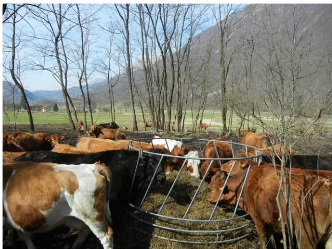
Slika št. 5: Krmljenje krav dojlj v tekališču

S pravilno osemenitvijo krav, ki naj bo okoli jesenskega enakonočja (21. september) dosežemo telitve v času, ko je prirast travne ruše največji. V travi je tudi največ energije (ogljikovih hidratov) in manj beljakovin. Ob taki paši bo krava dojlja dobila dovolj hranilnih snovi za vzdrževanje in prirejo toliko mleka, da bo z lahkoto odredila svoje tele. Pozimi tako kravo krmimo kot vsako presušeno kravo, saj potrebuje le vzdrževalno krmo.